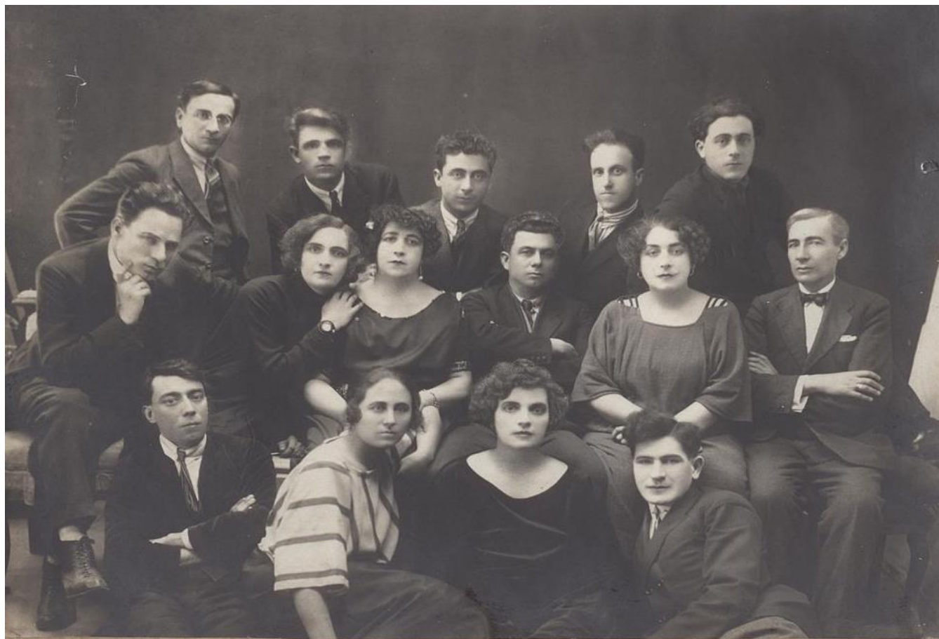
Снимка на групата на Хасковския театър от 1924 г.

През 1923 г. изграденият професионален театър има изработена официална бланка “Градски театър – Хасково”.