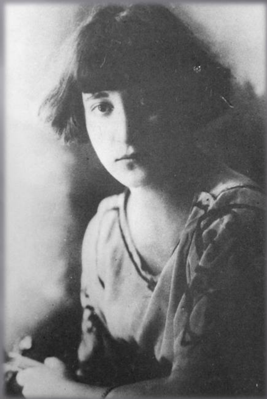
Нью Йорк, 1922 г.